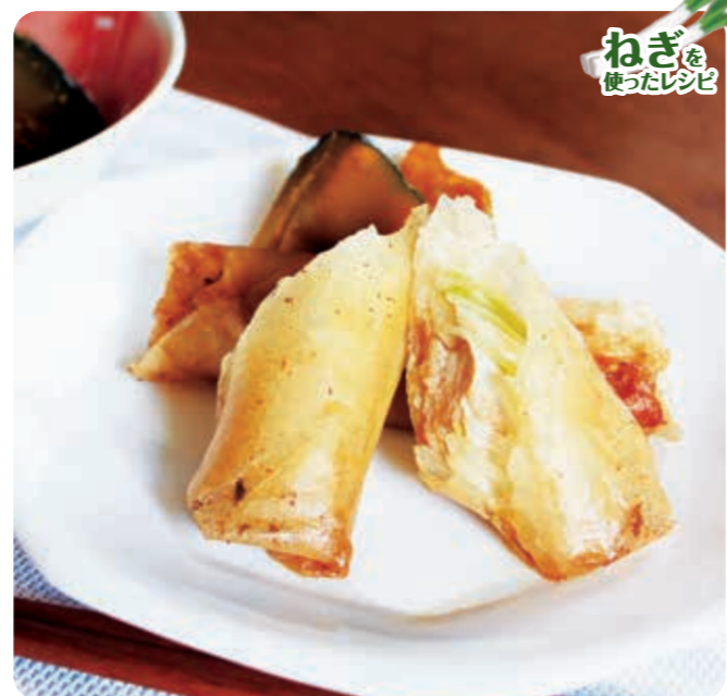
ねぎを使ったレシピ

ねぎは冬野菜の一つですが、冷房等で冷えた身体を温め、免疫力を高めるなど、夏にも活躍する食材です。ねぎと鶏肉のシンプルな組み合わせで、さっぱりとヘルシーに食べられます。簡単にすぐできるので、夏休みに親子で一緒に作るのにもおすすめです。チーズを入れても合います。