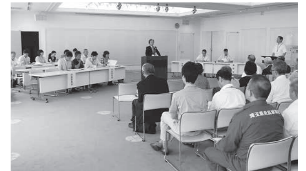
協働推進課協働推進・セーフコミュニティ担当(☎594-5571)

市長からの説明の後、それぞれの会議体ごとにこれまでの活動について報告がありました。どの対策委員会の報告もこれまでの活動がコンパクトにまとめられ、短い持ち時間の中で工夫されて、より分かりやすく、伝わりやすい内容でした。また、これまでの活動の報告だけでなく、より多くの市民の皆さんが安心して安全に暮らせるま