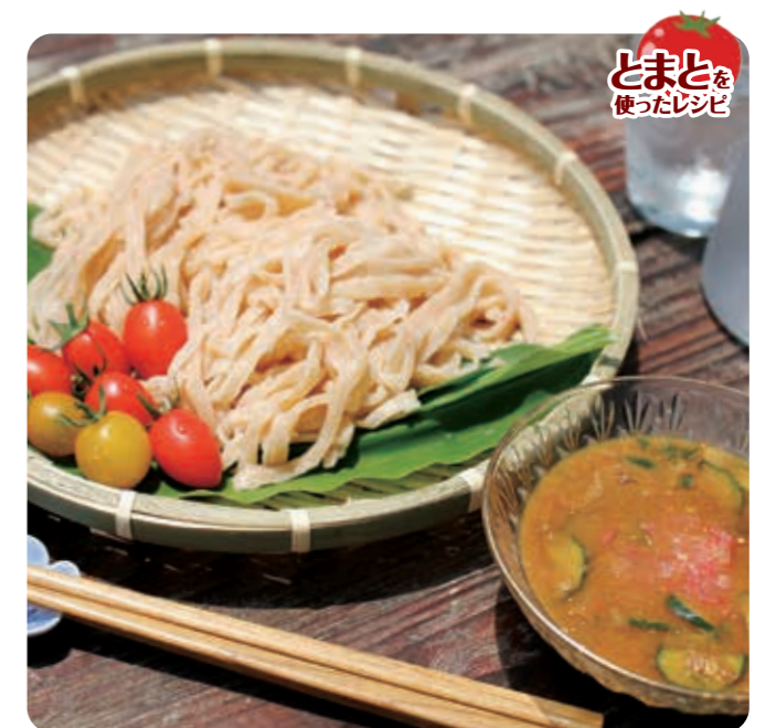
とまとを使ったレシピ

旬の野菜に味噌、ごまたっぷり入れた冷汁は栄養価が高く、うどんはのどの通りが良いため、食欲が落ちやすい暑い夏でもさっぱりと食べられます。とまとを加えることでさらに栄養素もプラスされるので、夏野菜を豊富に摂ることができる、栄養豊富な一品です。