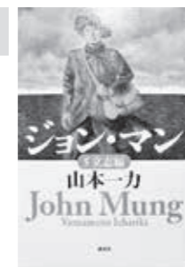
□ジョン・マン 5 立志編 山本 一力 (講談社)