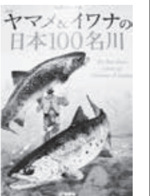
□新版 ヤマメ&イワナの 日本100名川 (地球丸)