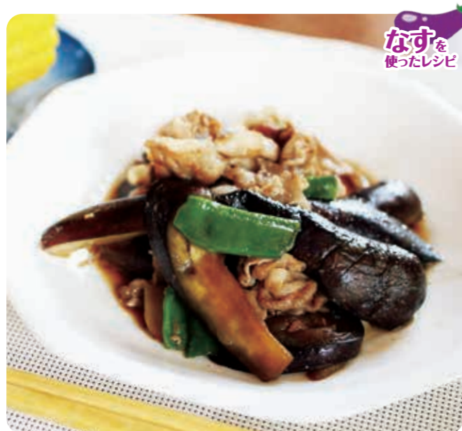
なすを使ったレシピ