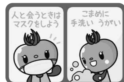
インプラス株式会社様が無償で作成