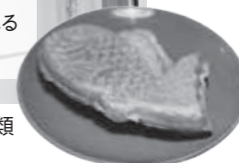
タイヤキは1個150円。味は5種類