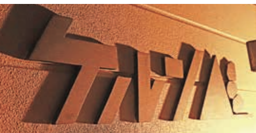
ケルンとは「山頂や登山道などの道標となるように、石を円錐状に積み上げたもの」を指す言葉。ケルンでの時間が積み重なりまちの道標になるように、との願いが込められています。

ケルンは、1階はシェアキッチン、2階はシェアスタジオになっており、日替わりで飲食店や写真館が営業しています。ケルンに入居する人たち同士がつながり、ケルンに出店したお店と地元のお店がコラボレーションする等の新しい交流が生まれました。そうした人の活気が作用したか、今では清水ショッピングセンターすべてにお店や会社が入っています。