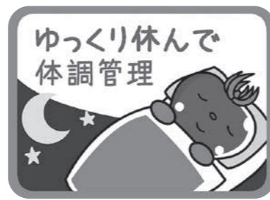
インプラス株式会社様が無償で作成

申 問 はがきまたはFAXで「植木剪定講習希望」と記入の上、①氏名(フリガナ)②年齢③電話番号④郵便番号⑤住所を明記し、北本市シルバー人材センター(☎592-4300・FAX593-2759・〒364-0013北本市中丸10-55)へ。 ※1月20日(水)必着。