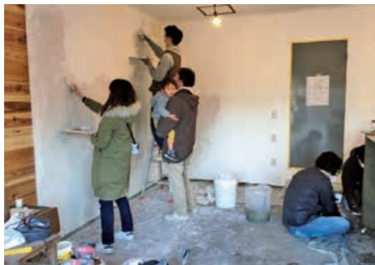
清水ショッピングセンターの改修作業は、地元の若者たちを中心とした有志が手作業で行いました。