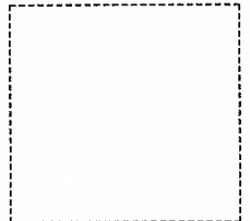
取扱金融機関受付印